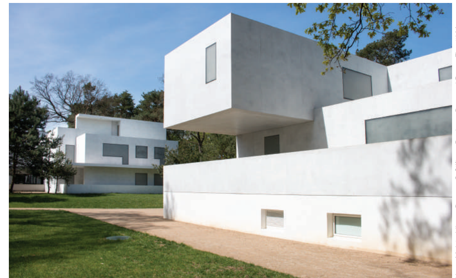
Neue Meisterhäuser Dessau